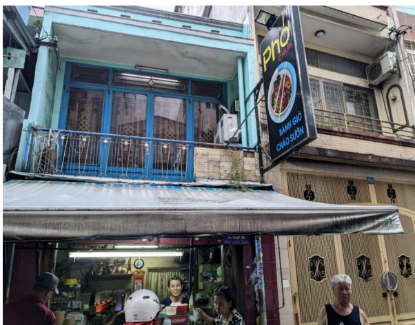
Hình quán ăn chụp năm 2003

Có khi thêm một đĩa bánh cuốn Lạng Sơn hay một tô phở chua hoặc một chén cháo xườn, tôi phải mất cả nửa tiếng đồng hồ chờ đợi vài cái bánh cuốn nhân thịt cuốn méo mó xấu xí đưa ra từ một cửa hàng bánh cuốn Lạng Sơn trong xóm Bàn Cờ, cách nhà tôi khoảng 50 mét.