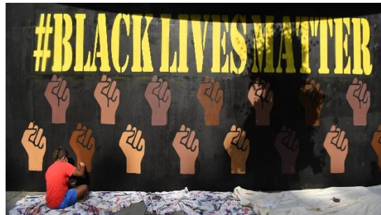
BLACK LIFE MATTER