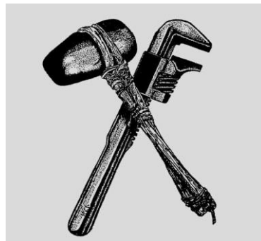
EARTH LIBERATION FRONT