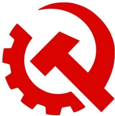
COMMUNIST PARTY USA