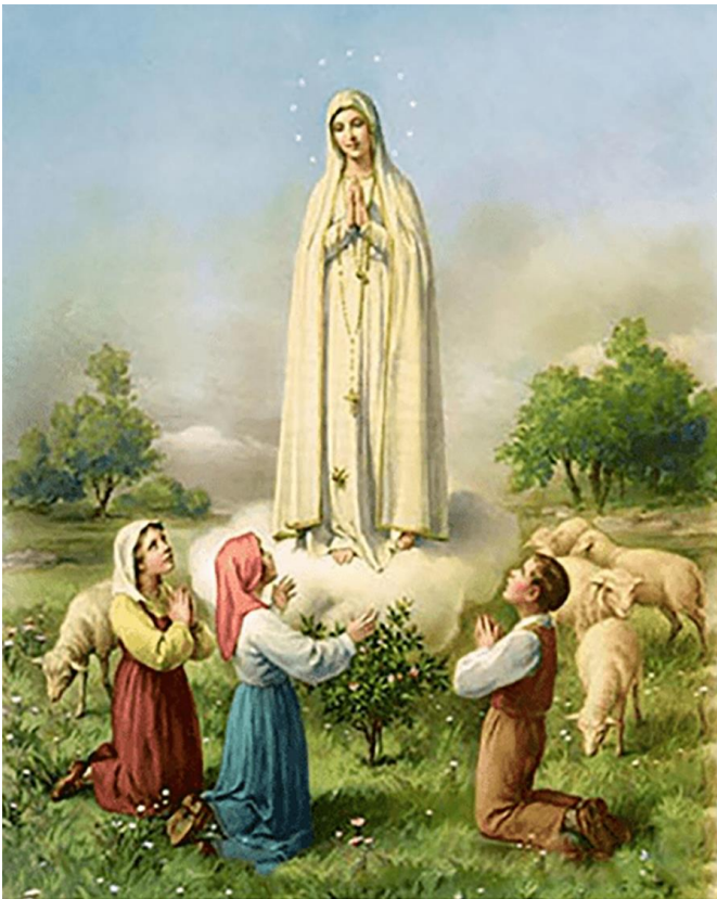
Đức Mẹ Fatima

Thật vậy, các bác sĩ tuyên bố viên đạn đã